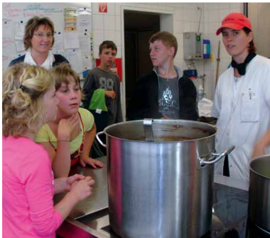
Schüler der Carl-Sandhaas-Schule bestaunen die großen Töpfe, in denen seit Neuestem ihr Mittagessen gekocht wird.