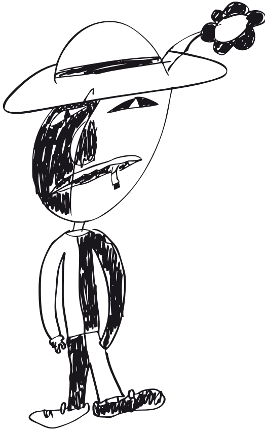
>> Ausstellung der Kreativwerkstatt: „Helles und Dunkles in meinem Leben.“

ner ist – wie wird man zu einem? Was weiß man(n) über Sexualität und wie geht man(n) mit Mädchen um?